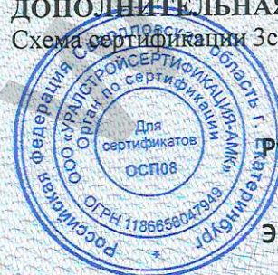
Схема сертификации 3с